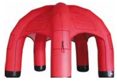
ca. 5 m