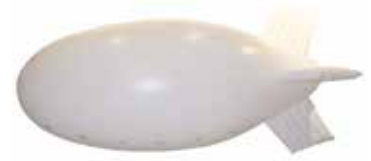
ca. 6 m

*bei normaler Verschmutzung, zusätzlicher Reinigungsaufwand wird separat in Rechnung gestellt