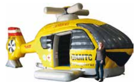
ca. 10 m