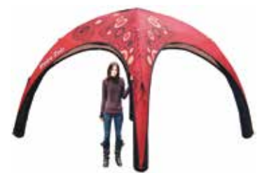
ca. 4 m

*bei normaler Verschmutzung, zusätzlicher Reinigungsaufwand wird separat in Rechnung gestellt