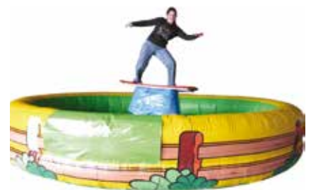
ca. 5 m

Dieses Action Game wird nur mit Eventpersonal von no problaim vermietet (siehe Seite 17).