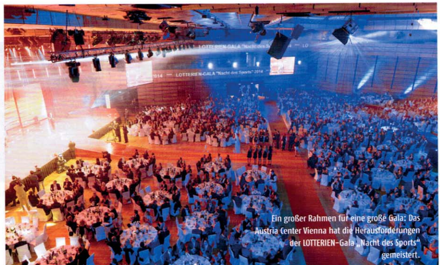
Ein großer Rahmen für eine große Gala: Das Austria Center Vienna hat die Herausforderungen der LOTTERIEN-Gala „Nacht des Sports“ gemeistert.